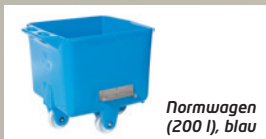
Normwagen (200 l), blau